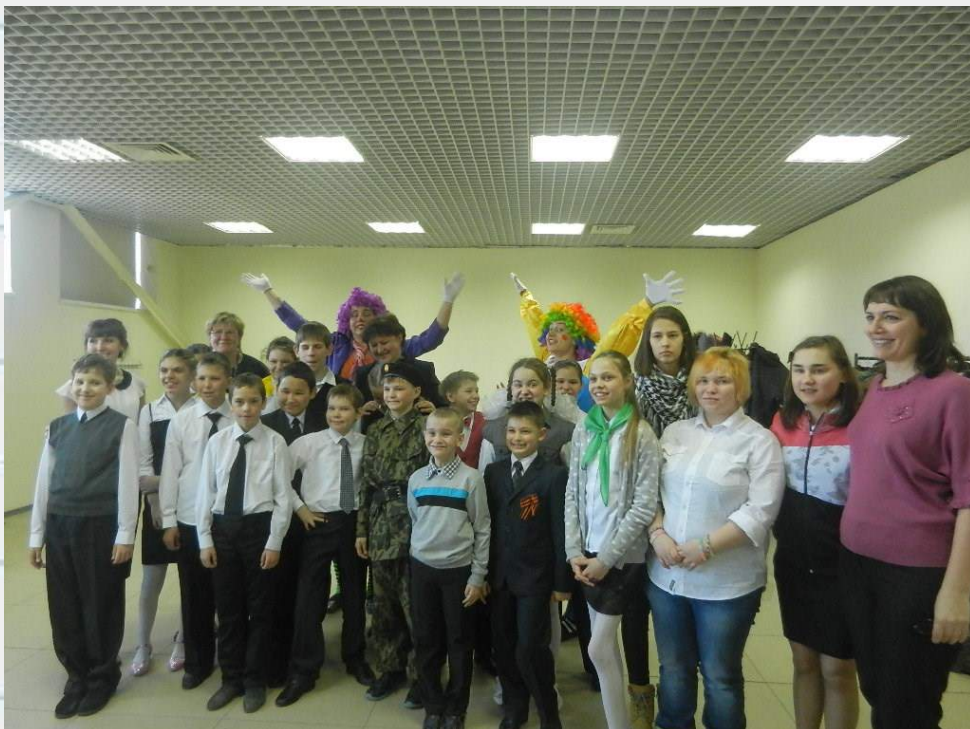
В городской конкурс для учащихся образовательных учреждений, реализующих адаптированные образовательные программы г. Челябинска «Лучики»