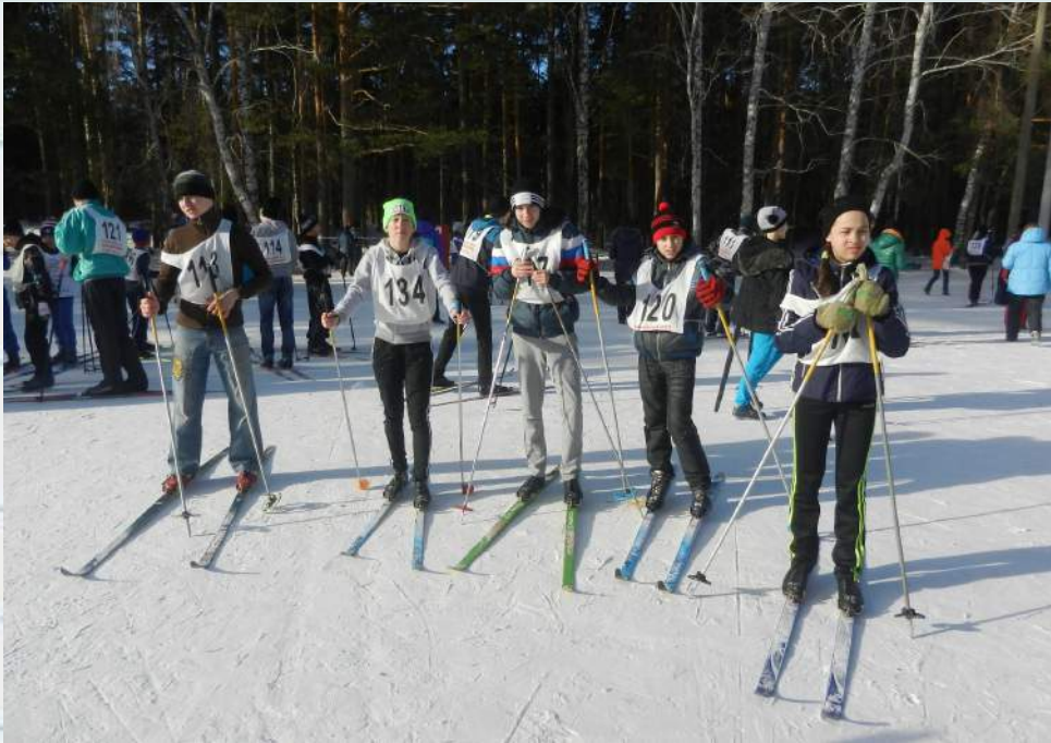
Городские соревнования по лыжам среди детских домов и школ-интернатов