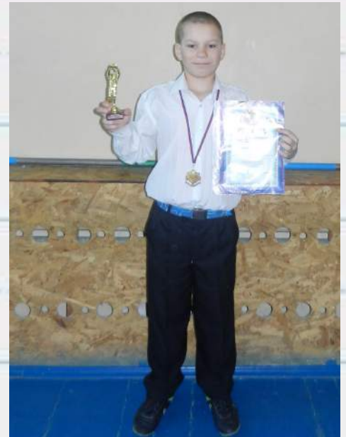
Городской конкурс детского творчества по безопасности дорожного движения «Мама в автомобиле»