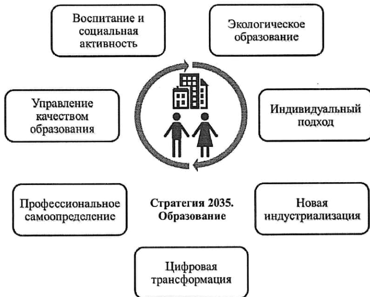
Рис. 3. Основные направления деятельности муниципальных инновационных площадок

Основные направления деятельности муниципальных инновационных площадок в 2022 году представлены на рисунке 3.