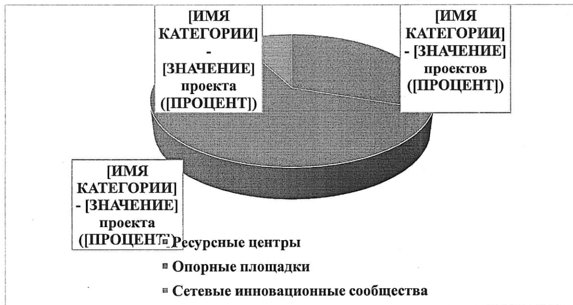
Рис. 2. Форматы реализации муниципальных инновационных проектов

Наиболее распространенный формат реализации муниципальных инновационных проектов – опорная площадка и ресурсный центр. Количество проектов, реализуемых сетевыми инновационными сообществами, ограничено по тематике, но обеспечивает вовлечение в процесс большое количество образовательных организаций, так в 4-х проектах участвуют 27 образовательных организаций. Ресурсные центры также обеспечивают широкое вовлечение в инновационную деятельность образовательных организаций муниципальной образовательной системы через организацию сетевого взаимодействия с базовыми площадками или соисполнителями проекта. Форматы реализации муниципальных инновационных проектов представлены на рисунке 2.